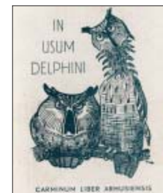
SANGBOG - Studenterrådet udgav i 1948 sangbogen "In Usum Delphini."

BOGIMPORT - Studenterrådet oprettede i 1949 Studenternes Bogimport for at skaffe studenterne udenlandske bøger til lavere priser end hos de almindelige boghandlere. Bogimporten blev senere til Akademisk Boghandel.