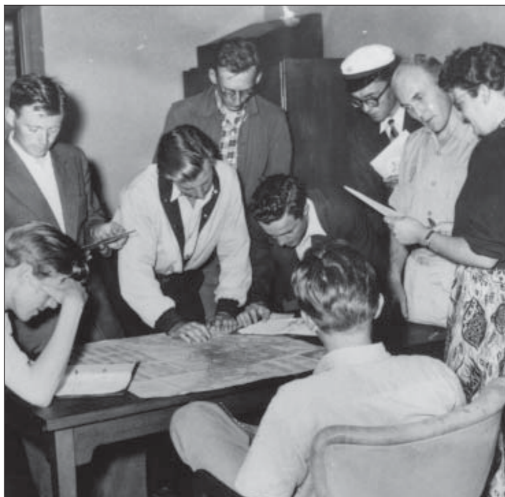
VÆRELSESANVISNING - Studenterrådets værelsesanvisningen 1953.

denterrådet standset af rektor, som stærkt frarådede voldsomme demonstrationer og anbefalede spagere protestformer. Man frygtede selvfølgelig "norske tilstande" – dvs. tyskernes arrestation af ansatte og studenter, sådan som det skete i Oslo.