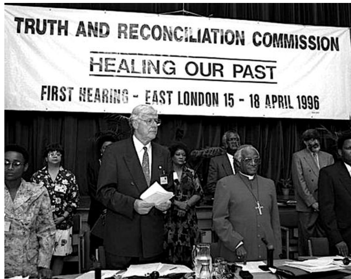
Sydafrikas Sandheds- og Forsoningskommission afholdt sine første høringer i april 1996. I Komitéen for Menneskerettighedskrænkelser berettede apartheidofre om de menneskerettighedskrænkelser, de havde været udsat for, og i Amnestikomitéen fortalte gerningsmænd om deres forbrydelser med henblik på at modtage amnesti.