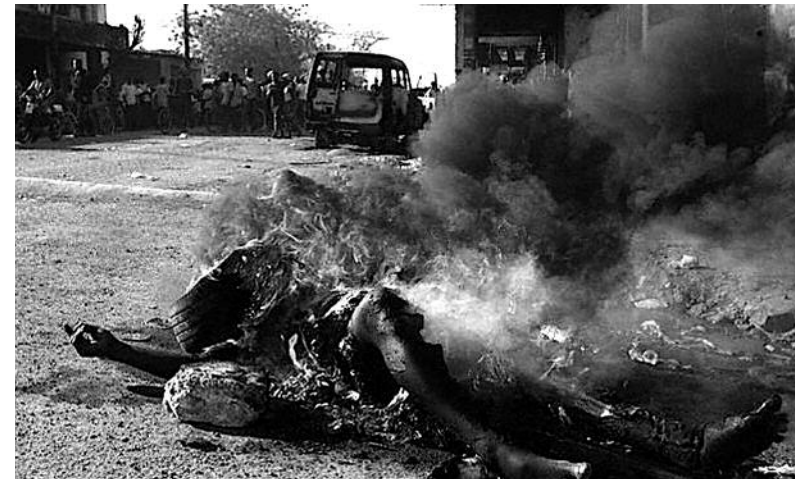
Necklacing er en drabsmetode, hvor ofret får et bildæk om halsen, der antændes. Drabsmetoden er blevet praktiseret både under og efter apartheid