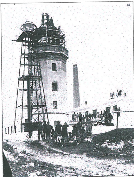
HANSTHOLM FYR under den store ombygning 1889, hvor det blev til verdens mest moderne med bl.a. elektrisk lys.