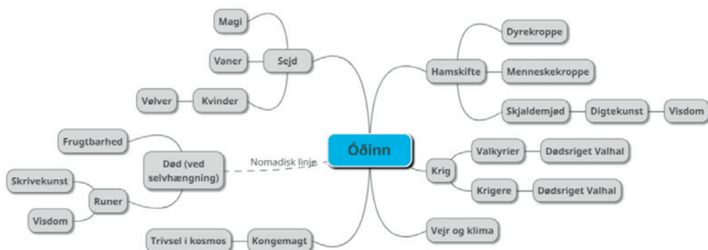
Óðinns identitet som et rhizom. Figuren viser hvilke domæner Óðinn knytter sig til og har adgang til. Illustreret af Emma Jørgensen