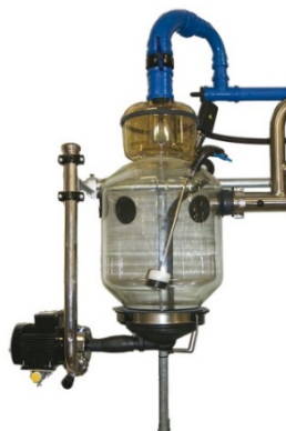
Frekvensstyret mælkepumpe samt mælkeudskiller med bufferkapacitet.

Effektiviteten af brøndvandskøling afhænger blandt andet af flowet af mælk gennem plade- eller rørkøleren. Ved anvendelse af en ureguleret mælkepumpe varierer mængden af mælk, der strømmer gennem køleren over tid, blandt andet som funktion af tid efter påbegyndt malkning. Når mælkeflowet gennem køleren varierer, vil energi-transporten fra mælk til vand ligeledes variere, hvilket bevirker, at mælken ved højt flow ikke nedkøles så meget som ved lavt flow. Ved at udskifte ældre uregulerede mælkepumper med frekvensstyrede mælkepumper samt installere en mælkeudskiller med stor bufferkapacitet kan flowet gennem køleren optimeres, hvorved mælken kan køles yderligere ned. Det forventes således, at mens for-køling med ureguleret mælkeflow kan sænke mælkens temperatur fra 36 til 20 °C er det muligt, via et stabilt optimalt mælkeflow, at reducere mælkens temperatur helt ned til 15 °C givet fremløbstemperaturen på brøndvandet er 8 °C, og at brøndvandets flow gennem køleren minimum er 2 liter per kg mælk.