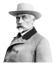
VIGGO HØRUP (1841-1902) STIFTER AF POLITIKEN I 1884

Redaktionen forbeholder sig ret til at redigere i indsendte tekster og til også at bringe teksterne på politiken.dk/debat. Vi bringer kun tekster alene sendt til Politiken. Opstår der problemer, kan du ringe til os på 33 47 12 00 eller 70 15 01 01.