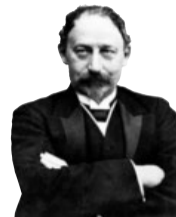
EDVARD BRANDES (1847-1931) STIFTER AF POLITIKEN I 1884