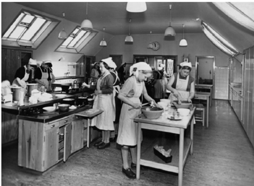
Nordvangsskolen i Glostrup, 1950'erne, skolekøkken.

Undervejs i alt dette blev der på AU-Library (det tidligere DPB) arbejdet med ordning, restaurering og digitalisering af de mange anskuelsestavler.