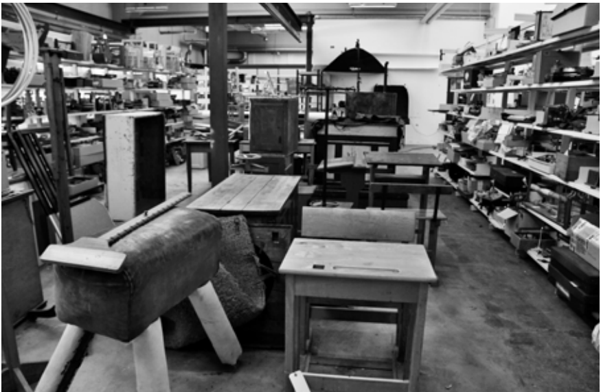
Skolemuseet udpakkes, august 2016