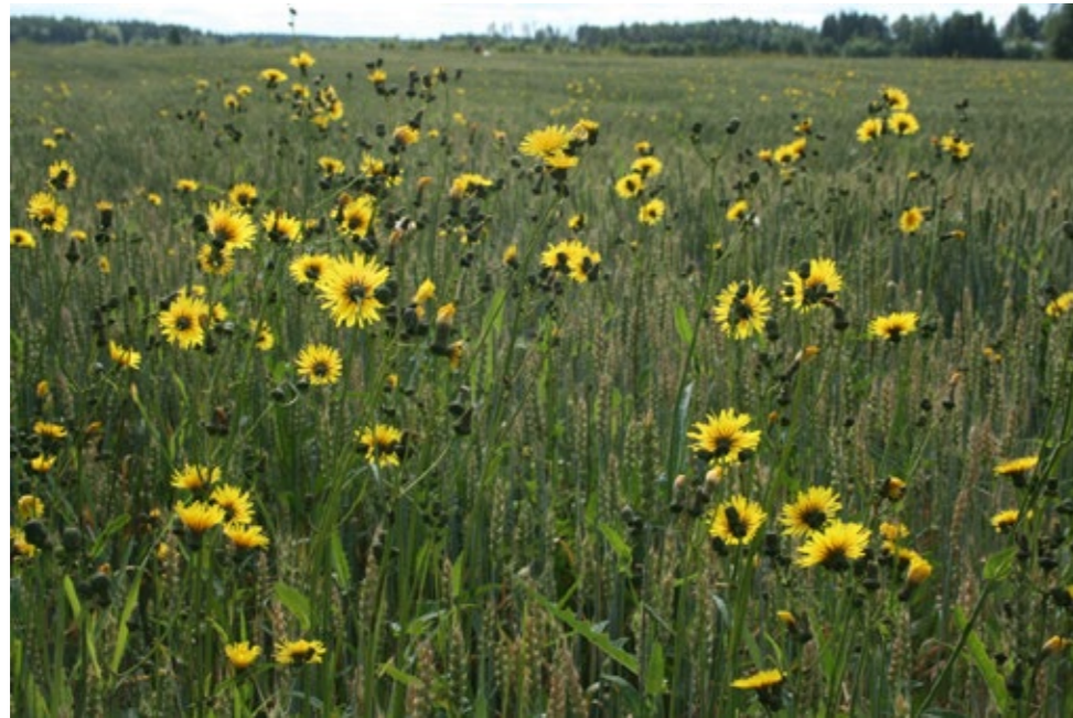
Ager-svinemælk – en af de 'store' rodukrudtsarter i økologisk jordbrug