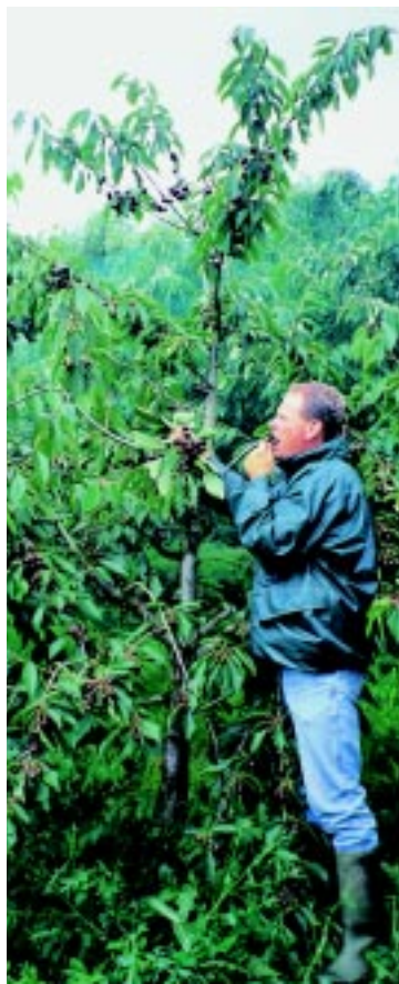
Sødkirsebær på svag grundstamme.

Træer, som har groet i potter, kan have snoede rødder, fordi der