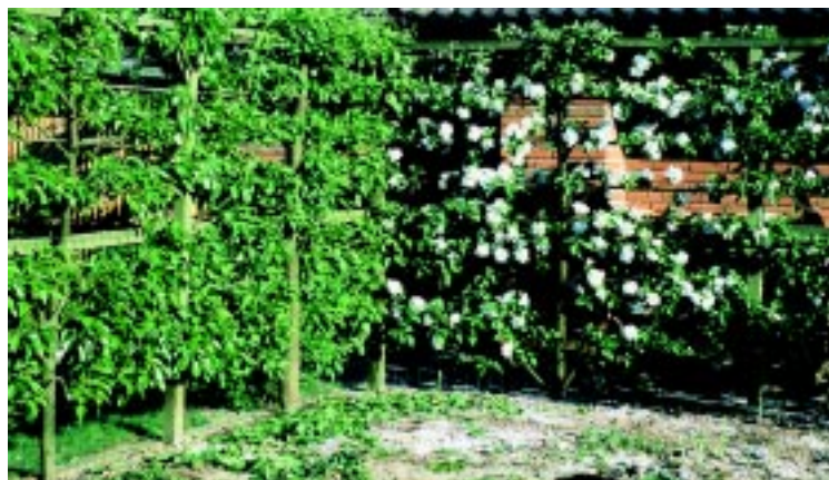
Espaliering af æble og pære omkring køkkenhave.

Et ungt træ har lettere ved at klare flytningen fra planteskolen til haven. Et etårs-træ har en lille top, og trækket på rødderne er ikke så stort, hvorimod det kræver