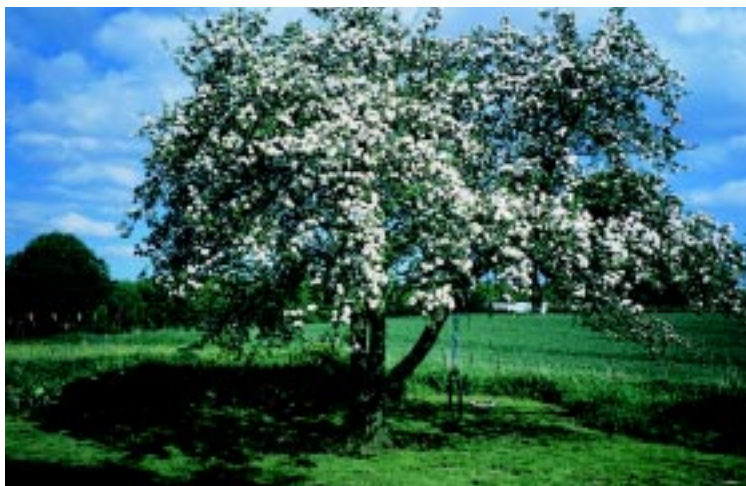
Kronetræ æble, enkeltstående.

re, når et æbletræ bærer frugter, kan frugtkvaliteten også påvirkes positivt f.eks. øges frugtens rødfarvning, hvis indholdet af kvælstof i jorden reduceres omkring frugtmodning.