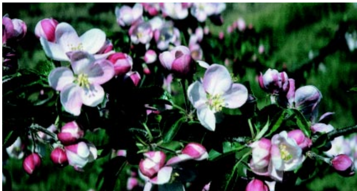
Æbleblomster i maj.

Nogle frugttræer, specielt æble, har tendenser til at bære frugt allerede i planteåret eller året efter. Hvis træet får lov at bære disse frugter frem, hæmmes den vegetative vækst for meget. Træets vækst stopper. Derfor anbefales det i begyndelsen af juli at fjerne frugter, der sættes de første år.